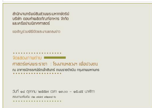
ภาพที่ 3 ภาพถ่ายของ อ.เวทิต ทองจันทร์ ที่ใช้ประกอบในบัตรเชิญสื่อมวลชน ขนาด A4 ใช้ประชาสัมพันธ์งานจัดแสดงภาพถ่าย 'ศาสตร์แห่งพระราช : โรงงานหลวงฯ เพื่อปวงชน'