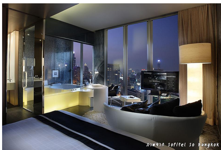
ภาพที่ 3.5 ห้องพักชาตุน้ำ