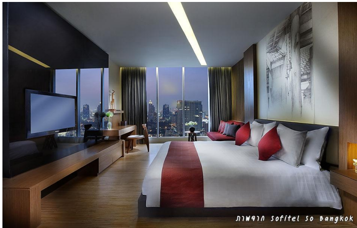
ภาพที่ 3.6 ห้องพักราคาตุลุม

ออกแบบโดยคุณณิธิ สถาปิตานนท์ ศิลปินแห่งชาติ สาขาศิลปะสถาปัตยกรรม (แบบร่วมสมัย) และประธานกรรมการบริษัท 49 Group การออกแบบคำนึงถึงหลักการตกกระทบของไม้กับแสงไฟ จนเกิดเป็นงานศิลปะที่ก่อให้เกิดความรู้สึกสงบสุข ซึ่งขัดแย้งกับความขุมนุ่นวุ่นวายและความคับคั่งของเมืองหลวงที่อยู่ด้านนอก ดังภาพที่ 3.6