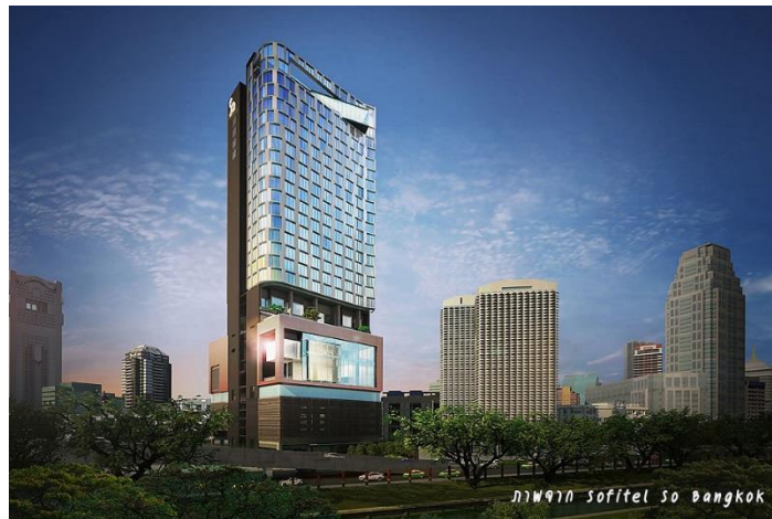
ภาพที่ 3.1 โรงแรม So Sofitel Bangkok

โรงแรม So Sofitel Bangkok เลขที่ 2 ถนนสาทรเหนือ เขตบางรัก กรุงเทพมหานคร 10500