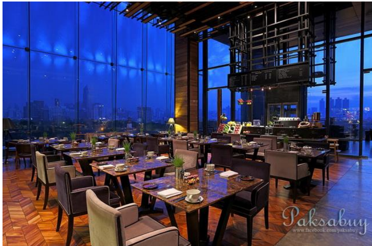
ภาพที่ 3.8 ห้องอาหาร Red Oven

โรงแรม So Sofitel Bangkok จะมีห้องอาหารอยู่ที่ชั้น 7 ตั้งอยู่ในฝั่งสวนลุมพินี ห้องอาหารนี้มีอาหารหลากหลายชนิด ชื่อของอาหาร Red Oven มาจากเตาโมดิณี สีแดงที่เป็นเหมือนสัญลักษณ์ของห้องอาหารแห่งนี้ ซึ่งเตานี้เปรียบเสมือนเป็น รถเฟอร์รารีในด้านเตาทำอาหาร เตาโมดิณีมีความโดดเด่นในเรื่องของดีไซน์ที่ดีเยี่ยมระดับตำนาน เป็นงานฝีมือที่ดีเยี่ยม ลงการเคลือบด้วยมือและเคลือบทับด้วยทองแดงด้วยความร้อนและประสิทธิภาพการทำงานที่ดีเยี่ยม เตาโมดิณี ทำให้อาหารแต่ละจานให้ออกมามีชีวิตชีวน่ารับประทานมากขึ้น