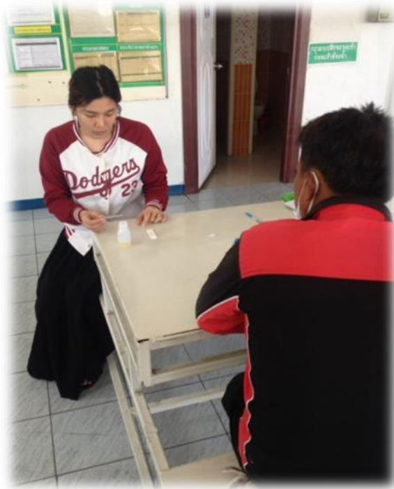
รูปที่ 1.3 ภาพตรวจสอบสารนิโคตินพนักงานช่วยเหลือ