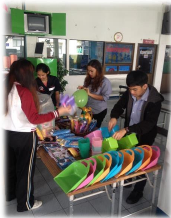
รูปที่ 1.2 ภาพจัดเตรียมกิจกรรมวันงดสูบบุหรี่โลก