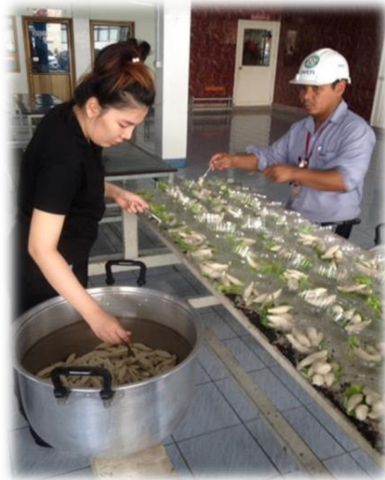
รูปที่ 1.4 ภาพแจกถุงขึ้นปลาโครงการอาหารเพื่อสุขภาพ