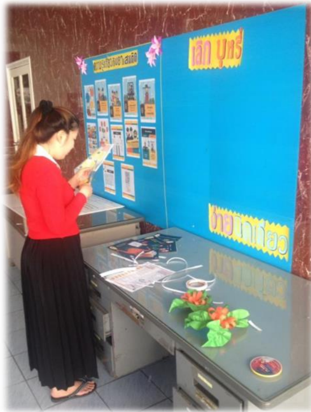
รูปที่ 1.1 ภาพการจัดบอร์ดประชาสัมพันธ์เด็กบุกร