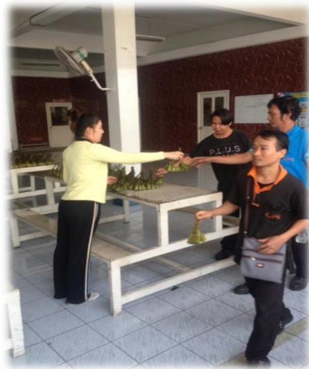
รูปที่ 1.6 ภาพแจกขนมไทย โครงการอาหารเพื่อสุขภาพ