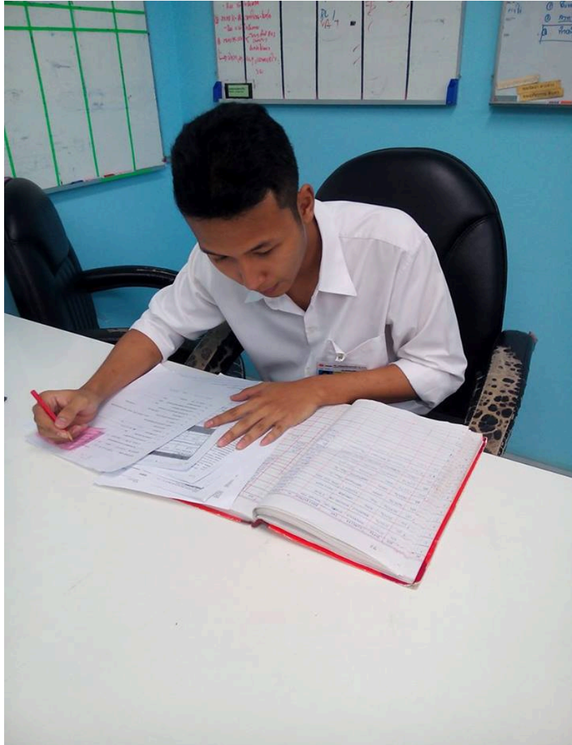
รูปภาพ 1.1 ตรวจสอบ Draft B/L