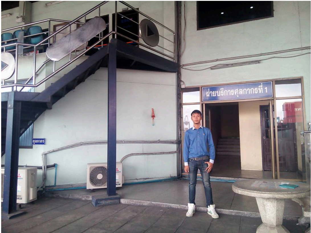
รูปภาพที่ 1.5 นำเอกสารต่างๆมาขึ้นไว้กับทางบริษัทขนส่งเพื่อออกสินค้า