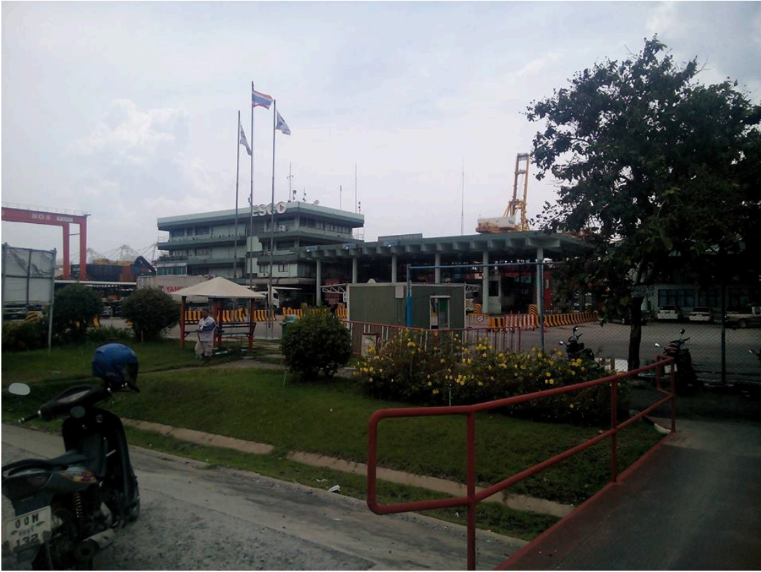
รูปภาพ 1.4 แลชมบังหน้าบริษัท ESCO ซึ่งเป็นที่ที่สินค้าทุกบรรจุอยู่ในตู้คอนเทนเนอร์